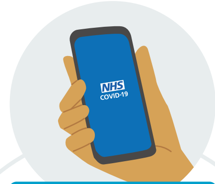
NHS COVID-19 App

ਇਹ ਐਪ ਇੱਕ ਵਰਤੋਂਕਾਰ ਦੀ ਗੁੰਮਨਾਮੀ ਨੂੰ ਸੁਰੱਖਿਅਤ ਰੱਖਦੇ ਹੋਏ ਕੰਮ ਕਰਦੀ ਹੈ। ਸਰਕਾਰ ਸਮੇਤ, ਕੋਈ ਵੀ ਵਿਅਕਤੀ, ਨਹੀਂ ਜਾਣ ਸਕੇਗਾ ਕਿ ਖਾਸ ਵਰਤੋਂਕਾਰ ਕੌਣ ਜਾਂ ਕਿੱਥੇ ਹੈ।